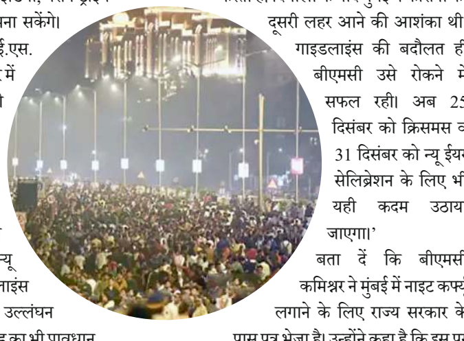
दूसरी लहर आने की आशंका थी। गाइडलाइंस की बंदौलत ही बीएमसी उसे रोकने में सफल रही। अब 25 दिसंबर को क्रिसमस व 31 दिसंबर को न्यू ईयर सेलिब्रेशन के लिए भी यही कदम उठाया जाएगा। बता दें कि बीएमसी कमिश्नर ने मुंबई में नाइट कर्फ्यू लगाने के लिए राज्य सरकार के पास पत्र भेजा है। उन्होंने कहा है कि इस पर 20 दिसंबर के बाद राज्य सरकार कोई फैसला कर सकती है।