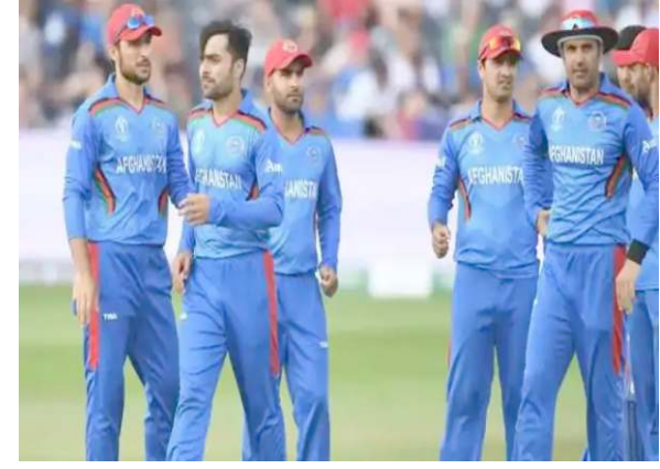
अफगानिस्तान टीम के कुछ खिलाड़ी इस समय ऑस्ट्रेलिया में मौजूद हैं और वह सीरीज की

दोनों टीमों के बीच होने वाली यह वनडे सीरीज पहले आबुधाबी में खेले जाने वाली थी, लेकिन वीजा की समस्या के चलते इसको ओमान शिफ्ट किया गया है। आयरलैंड की टीम आबुधाबी पहुंच चुकी है और अपनी तैयारियों में जुट गई है। आयरलैंड की टीम ने साल 2020 में इंग्लैंड का दौरा किया था, जहां टीम को एकदिवसीय सीरीज में 2-1 से हार का सामना करना पड़ा था। हालांकि, टीम ने आखिरी वनडे मैच में इंग्लैंड को पटखनी दी थी।